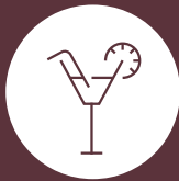
Bar & Lounge